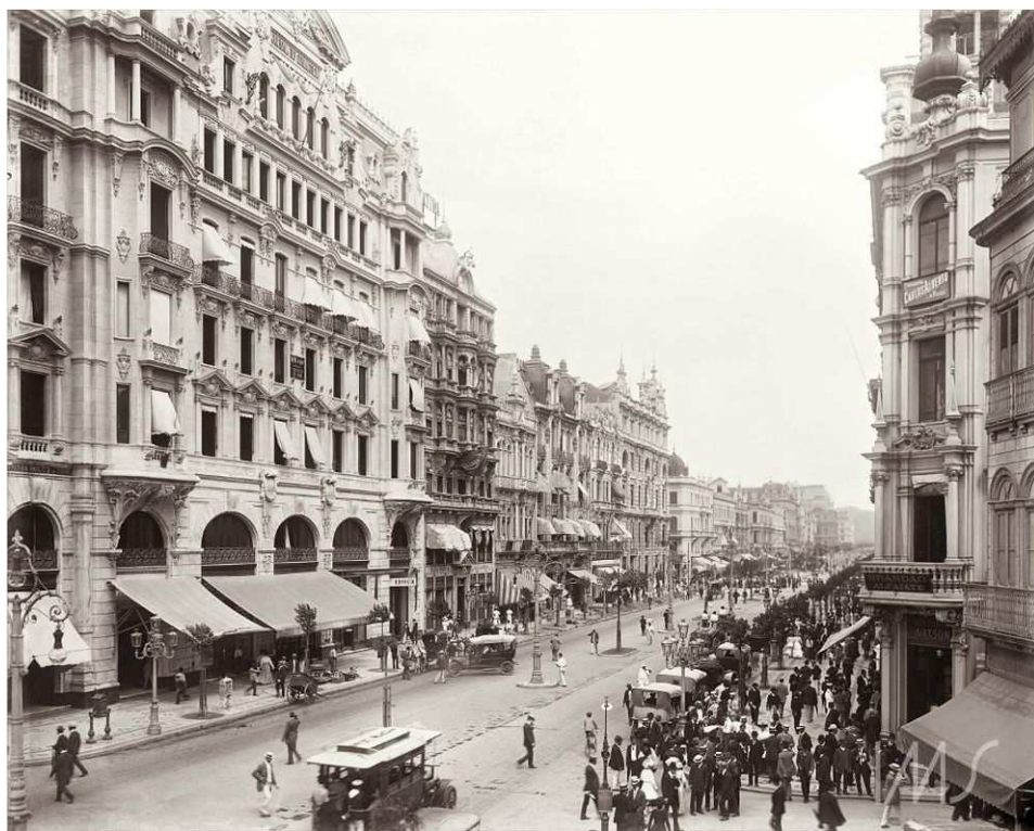
Аvenida Централ (сегодня — Avenida Рио-Бранко), 1906 г.

Круза (Фиокруз). Но даже наличие столь солидного учреждения не смогло стать основанием для снижения уровня преступности. Однако при подготовке к летней Олимпиаде 2016 г. власти города добились определенных успехов.