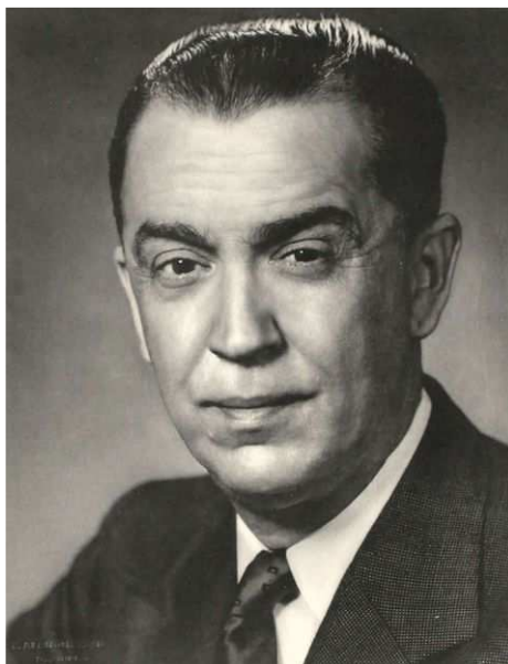
Жуселину Кубичек де Оливейра

Столица Бразилии, в отличие от большинства столиц стран Латинской Америки, находится не на побережье, а в центральной части страны. По словам Ж.Готтманна, Бразилиа была спроектирована в форме самолета, чтобы напоминать нам о новых возможностях нашей