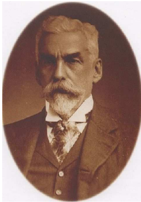
Франсиску Перейра Пассос (1836—1913), мэр Рио-де-Жанейро в 1902—1906 гг.

Рио-де-Жанейро с его многочисленными холмами и горами поражает своей красотой, поэтому неудивительно, что он был выбран местом проведения Чемпионата мира по футболу 2014 г. и летних Олимпийских игр 2016 г. Однако у бывшей столицы Бразилии есть и темная сторона: фавелы, густонаселенные жилые кварталы, где стены домов исчерканы надписями и рисунками, многие из них со следами от пуль, и где улочки на-