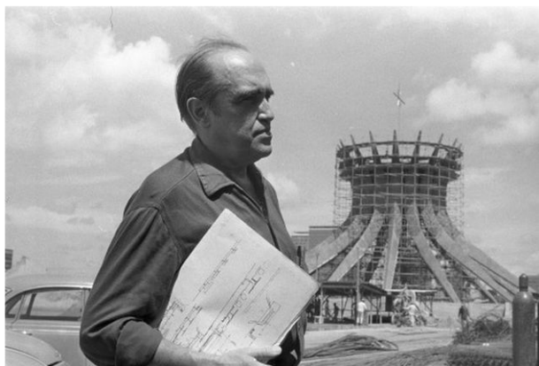
Оскар Рибейру ди Алмейда ди Нимейер

именно — социальной сегрегации, причем современные реалии свидетельствуют о том, что социальная сегрегация не только не сокращается, но, наоборот, усиливается 43 . Для города также характерны пространственная и функциональная фрагментации, которые создают определенные сложности для повседневной жизни населения.