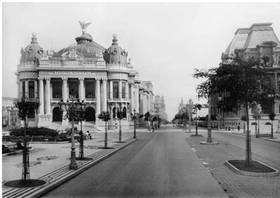
Вид на Муниципальный театр и Авенида Централ (1909 г.)

столько узкие, что зачастую по ним нельзя проехать на машине. В настоящее время в Рио-де-Жанейро примерно 12% семей живут без водопровода, свыше 30% семей не имеют канализации, и только две трети семей официально подключены к сети энергоснабжения 23 . Великолепный мост Рио-Нитерой длиной 13,290 км через залив Гуанабара — самый протяженный 24 мост в странах Западного полушария и шестой по величине в мире — раскинулся над водой, которая отдает запахом нечистот, поскольку бытовые и сточные отходы зачастую сбрасываются прямо в реки, дренажные каналы и отстойники.