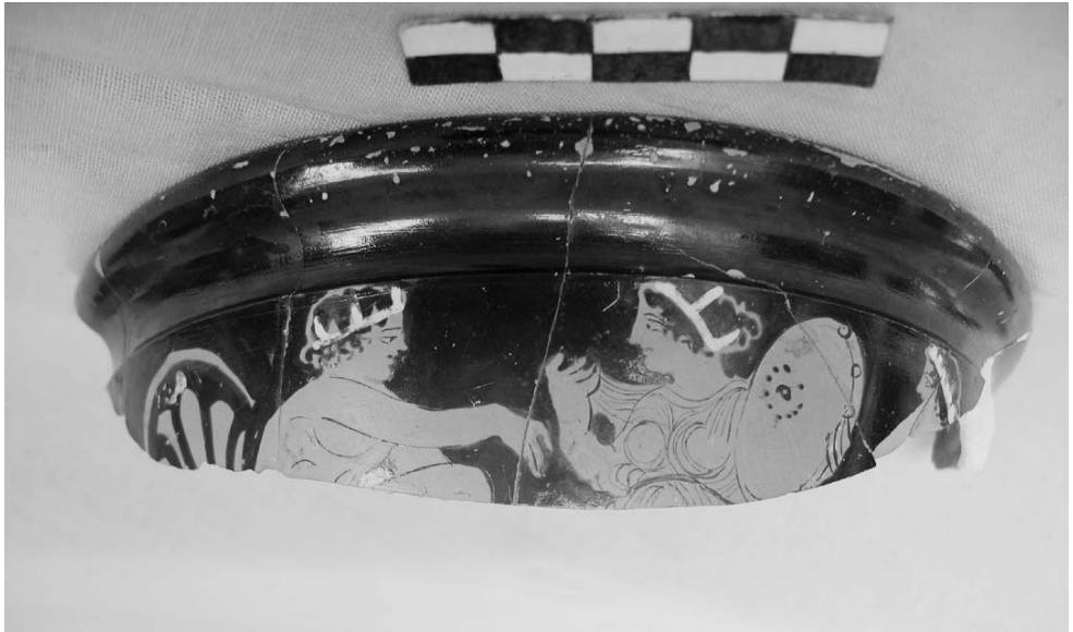
Рис. 1. Фрагмент краснофигурного килика IV в. до н.э. Национальный заповедник «Херсонес Таврический»