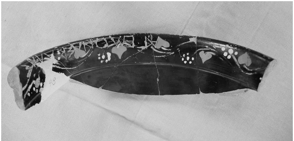
Рис. 2. Надпись на внутренней стороне килика