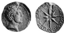
Рис. 3. Монета понтийского царя Полемона I (из коллекции В. Ваддингтона)

ние Понтийское царство, воссозданное им в 39 г. до н.э. Когда Полемон подавлял там вместе с Ликомедом из Понтийской Команы восстание Аршака, то уже имел титул царя (Strabo. XII. 3. 38), полученный при назначении в Киликию. Поэтому в следующем 36 г. до н.э., когда Марк Антоний отправился в неудачный поход против парфян, Полемон как царь Понта ( πλὴν τοῦ Πολέμωνος τοῦ ἐν τῷ Πόντῳ βασιλεύοντος ) принял в нем участие и сопровождал отряд Статиана, но попал в плен и был освобожден только за выкуп (Dio. Cass. XLIX. 25. 4; ср. также Plut. Ant. XXXVIII. 3: Πολέμων ἦν ὁ βασιλεὺς ). Царский статус Полемона подтверждают крайне редкие монеты, легенды которых величают его царем (рис. 3) 36 . Среди них есть экземпляры с портретом Марка Антония и Августа, причем среди последних – одна с легендой ΚΑΙΣΑΡΟΣ ΣΕΒΑΣΤΟΥ , как и в надписи из Зельи, а другая с латинской надписью IMP. CAESAR AVG , выпущенная, очевидно, позднее, когда в 25 г. до н.э. принцепс получил аккламацию как император в восьмой раз (см. выше). Авторы каталога монет коллекции Ваддингтона считали эти монеты сомнительными, однако Р. Салливэн совершенно справедливо усомнился в истинности такой оценки 37 . Как бы то ни было, монеты с легендой ΚΑΙΣΑΡΟΣ ΣΕΒΑΣΤΟΥ и ΒΑΣΙΛΕΩΣ ΠΟΛΕΜΩΝΟΣ подтверждают получение Полемоном I царского титула или скорее его подтверждение Августом в 26 г. до н.э.