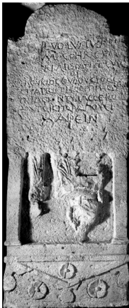
Рис. 4. Надпись КБН 691 из Пантикапея