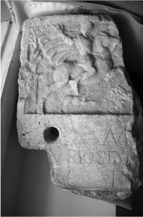
Рис. 6. Надгробие Луция Фурия Севта

были присланы на Боспор, как и воины Кипрской когорты. Это делает весьма вероятным, что \Theta\rho\alpha\mu\iota\delta\acute{o}\nu\ \tau\acute{\alpha}\upsilon\mu\alpha , упомянутая в новой танаисской надписи и в энкомии из Пантикапея, обозначала то же подразделение римских вспомогательных войск.